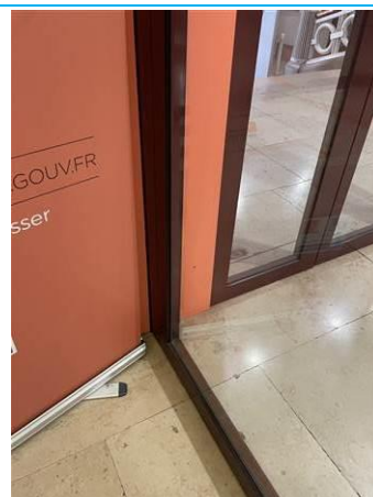
Matériaux : ZPSO-003 Prélèvement : P006 Description : Joint noir de vitrage du sas Localisation : Grand Hall Résultat : Absence d'amiante