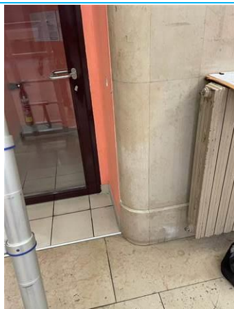
Matériaux : ZPSO-001 Prélèvement : P001 Description : Colle de marbre murale Localisation : Grand Hall Résultat : Absence d'amiante