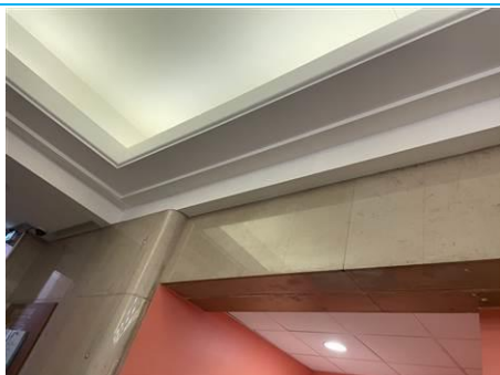
Matériaux : ZPSO-002 Prélèvement : P003 Description : Enduit peinture mur Localisation : Grand Hall Résultat : Absence d'amiante