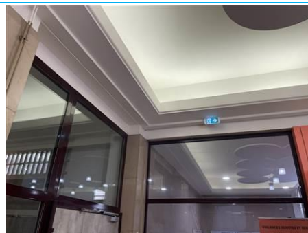
Matériaux : ZPSO-002 Prélèvement : P004 Description : Enduit peinture mur Localisation : Entrée Résultat : Absence d'amiante