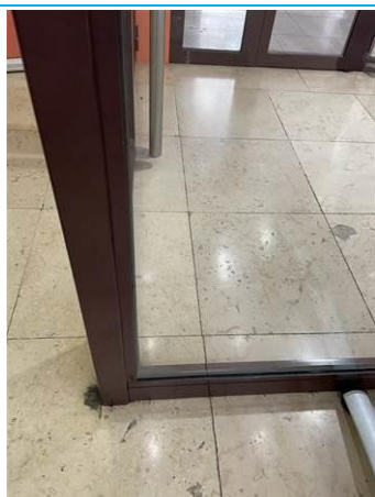
Matériaux : ZPSO-003 Prélèvement : P005 Description : Joint noir de vitrage du sas Localisation : Grand Hall Résultat : Absence d'amiante