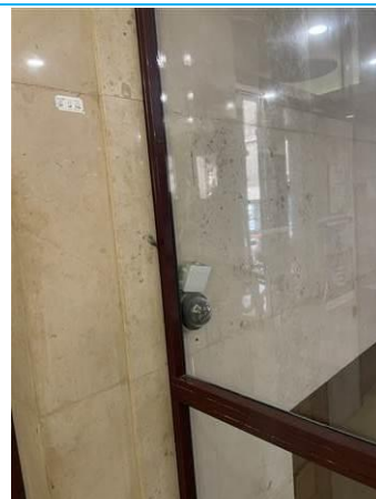
Matériaux : ZPSO-001 Prélèvement : P002 Description : Colle de marbre murale Localisation : Entrée Résultat : Absence d'amiante